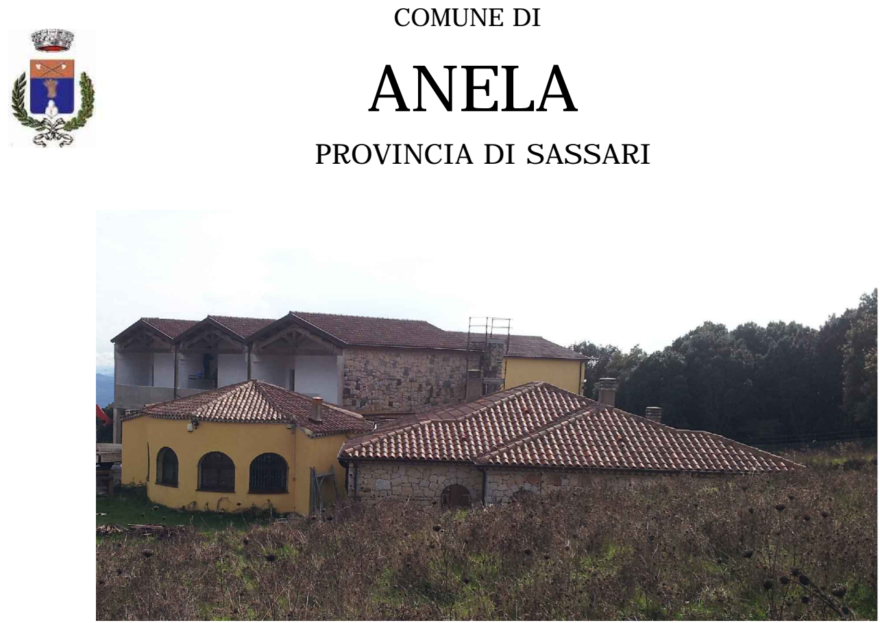
Lavori di realizzazione di un centro polifunzionale in località Badu Addes - completamento della zona residence Progetto di completamento